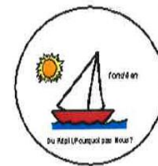
Répit Pabok, Chandler