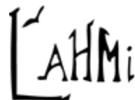
L'Association pour Personnes Handicapées de Murdochville Inc. 573, AVENUE MILLER C.P. 1192, MURDOCHVILLE, QUÉBEC G0E 1W0