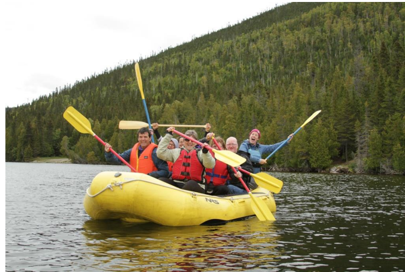
Sortie plein-air avec Association des personnes handicapées visuelles GIM, Murdochville

Direction Centre La Joie de vivre, Chandler