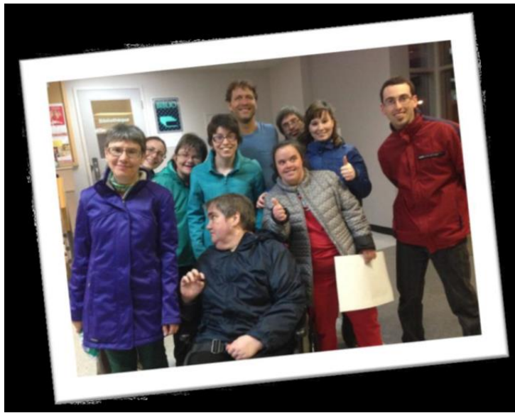
Sortie culturelle avec l'APHAC, Bonaventure