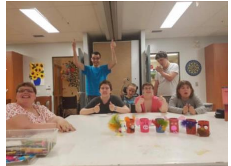
Ateliers d'art avec la Maison Maguire, Saint-Omer