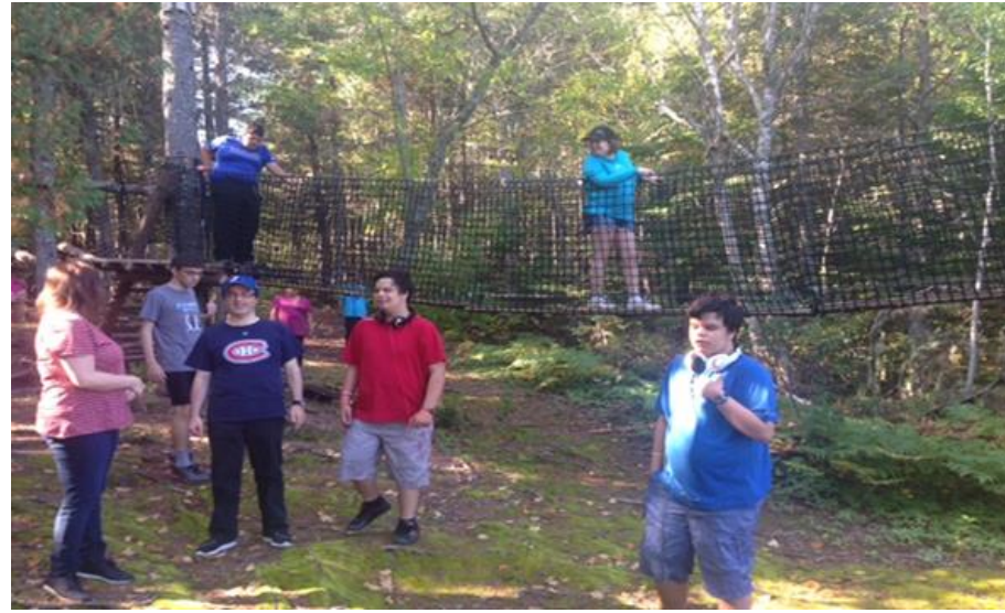
Camp de vacances et répit pour les familles avec Répit Pabok, Chandler

« L'Association des personnes handicapées Action Chaleur (APHAC) me donne l'occasion de faire de belles rencontres avec mes amis et vu qu'on est tous différents, j'accepte les amis comme ils sont et eux m'acceptent comme je suis. »